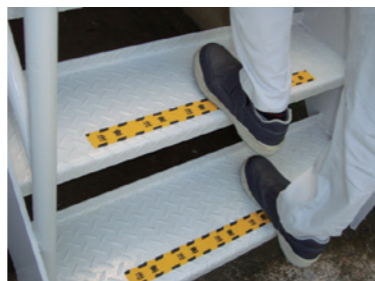
すべり止めテープ